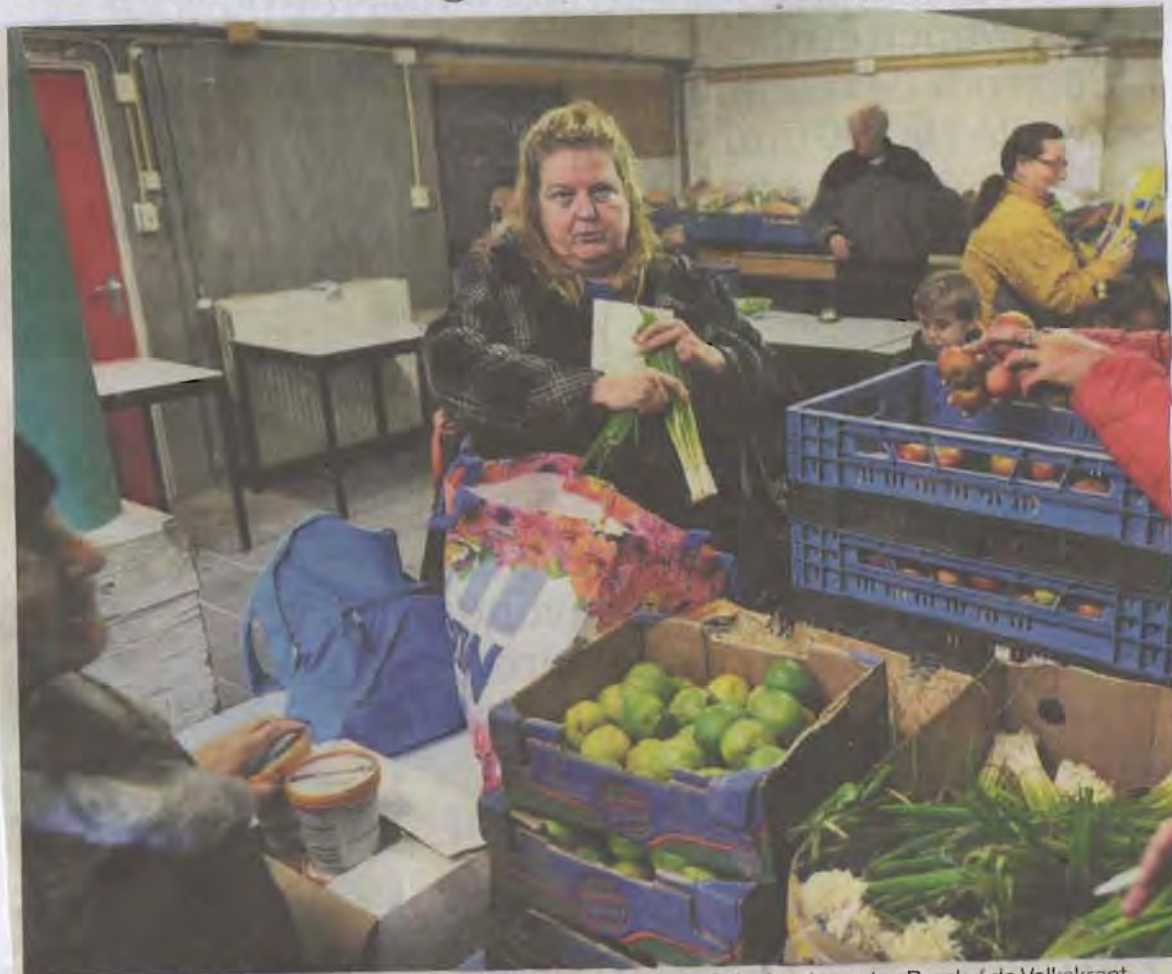
Bezoekers van de voedselbank in de Pijp in Amsterdam.